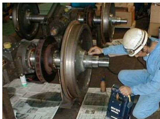
試験状況(斜角探傷)