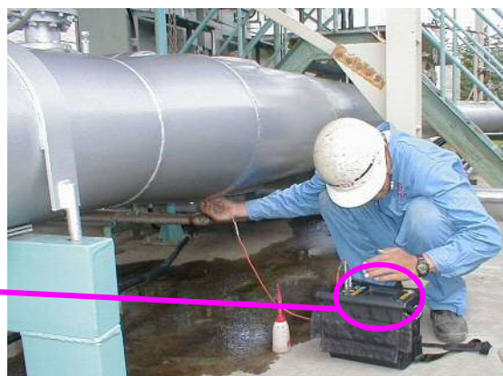
配管内水位測定状況