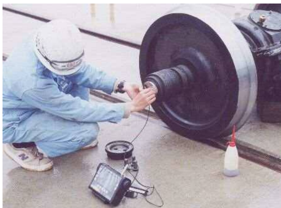
試験状況(垂直探傷)